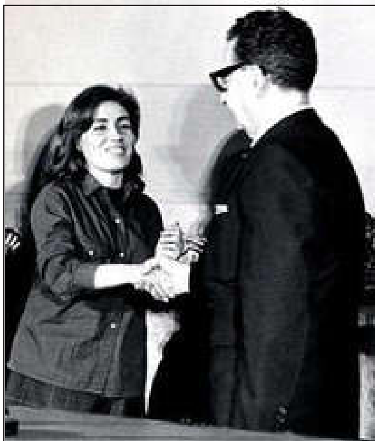
La camarada Gladys junto a Salvador Allende

"El pueblo de Chile, sus trabajadores, la clase obrera, la juventud, han escuchado la palabra del Presidente, compañero Salvador Allende. Los momentos y horas difíciles para nuestra patria que estamos viviendo, se han venido denunciando en forma reiterada; los intentos antipatriotas por derribar el gobierno legal, constitucional y democrático se están consumando.